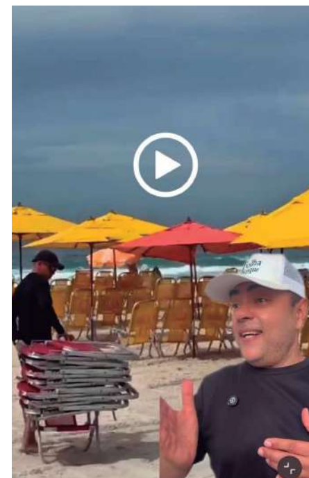
Trecho do vídeo da farra dos barraqueiros

No mesmo dia que o vídeo foi postado no Instagram da Folha, entretanto, a subprefeitura da Barra acabou com a farra das barracas e cadeiras no lugar. Em conjunto com a Coordenadoria de Controle Urbano, eles realizaram uma fiscalização para combater o cercamento irregular feito por barraqueiros no local. Nove barracas foram fiscalizadas e oito multas foram aplicadas devido a colocação de cadeiras e guarda-sóis na areia de forma abusiva, ocupando quase todo o espaço público.