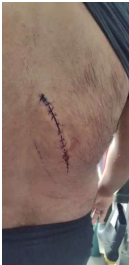
O corte nas costas do homem atropelado pelo jet ski

“Estamos à mercê da impunidade. E o mais grave: os órgãos reguladores nada fazem. A subprefeitura sabe. A prefeitura sabe. O problema é antigo, recorrente, denunciado e ignorado. Estamos falando de absurdos sobre absurdos. Até quando? Onde vamos parar? O que mais precisa acontecer para que providências sejam tomadas? E se esse caso tivesse sido fatal? Quem responderia? Quem explicaria para uma família que perdeu um filho, um pai, um neto? Não é só sobre lazer irresponsável. É sobre vida, respeito, história e dignidade. O silêncio do poder público também machuca. E pode matar.”, diz outro trecho da nota.