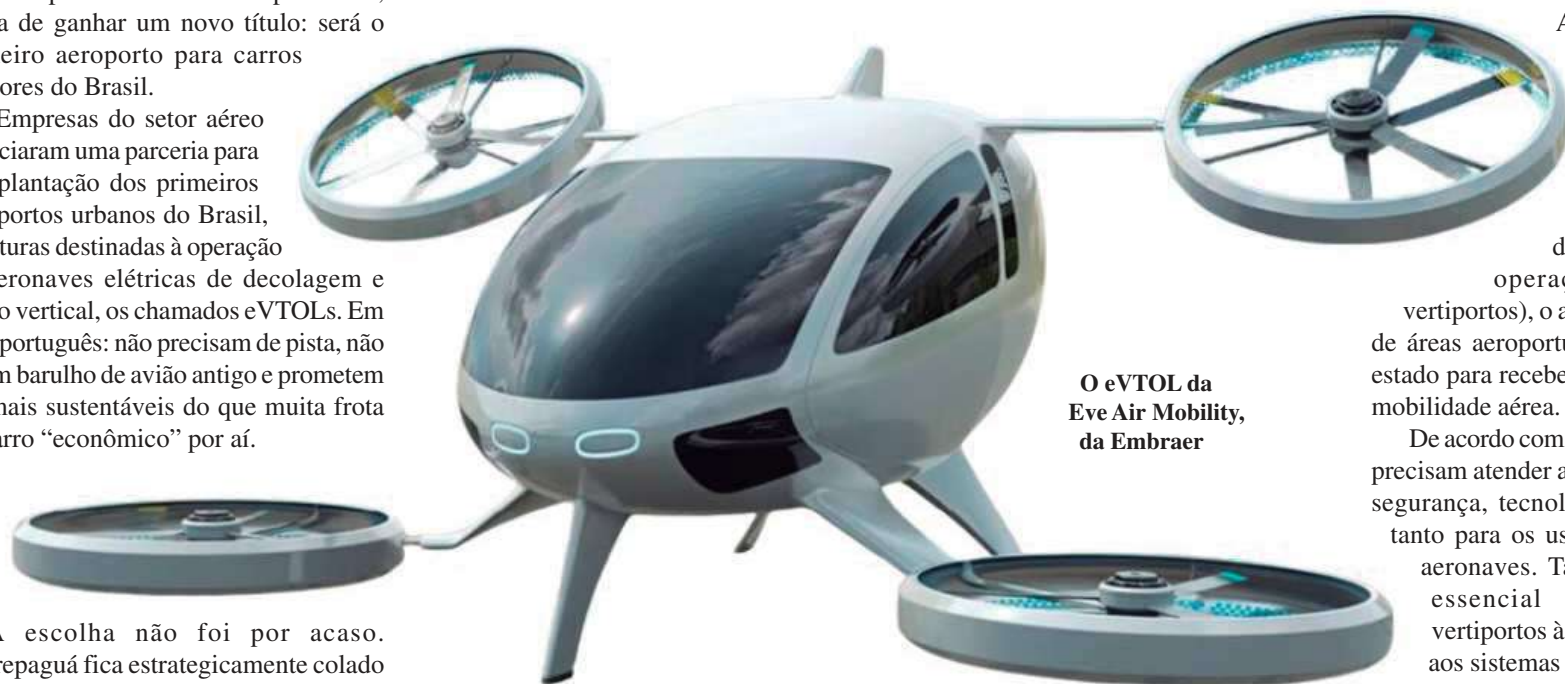
O eVTOL da Eve Air Mobility, da Embraer

Primeiro aeroporto para carros voadores do Brasil vai ficar na Zona Sudoeste