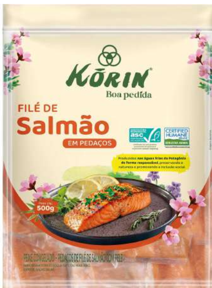
A embalagem com o salmão em postas

A operação é cronometrada para manter a integridade do