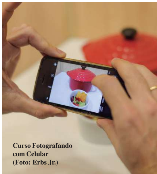
Curso Fotografando com Celular

O curso é gratuito e, para obter a certificação profissional, é necessário cursar todas as seis disciplinas oferecidas: Atendimento Hospitalareiro, Estratégias de Mídias Sociais,