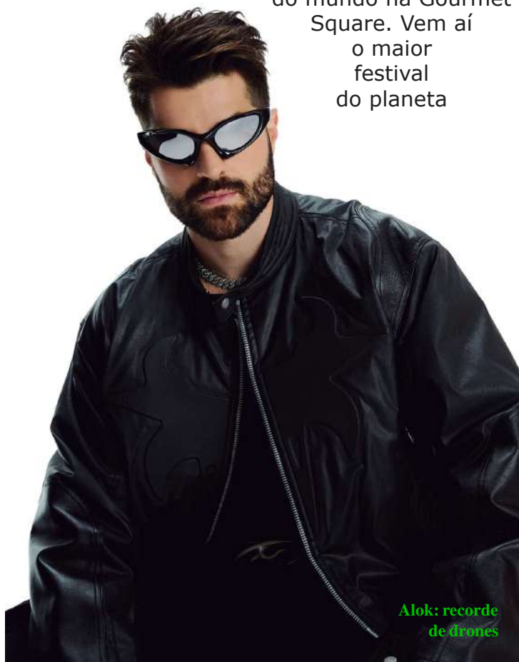
Alok: recorde de drones

Alok, Foo Fighters, Fatboy Slim e um dos 100 melhores pizzaiolos do mundo na Gourmet Square. Vem aí o maior festival do planeta