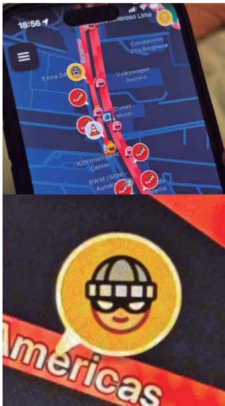
A tela do aplicativo com um alerta de insegurança na Avenida das Américas

Waze agora também aponta o “mapa do susto”. E a Barra anda piscando mais do que farol em engarrafamento