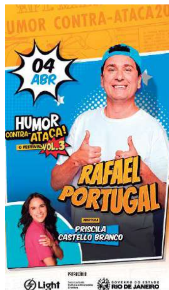
O cartaz do show do humorista Rafael Portugal

O festival Humor Contra-ataca acontece no Qualistage, até o dia 10 de abril. Depois de dois anos de grande sucesso, o evento está de volta à maior casa de espetáculos da cidade. Nomes consagrados da comédia nacional se unem a emergentes do ramo em mais uma sequência de gargalhadas, sempre com pelo