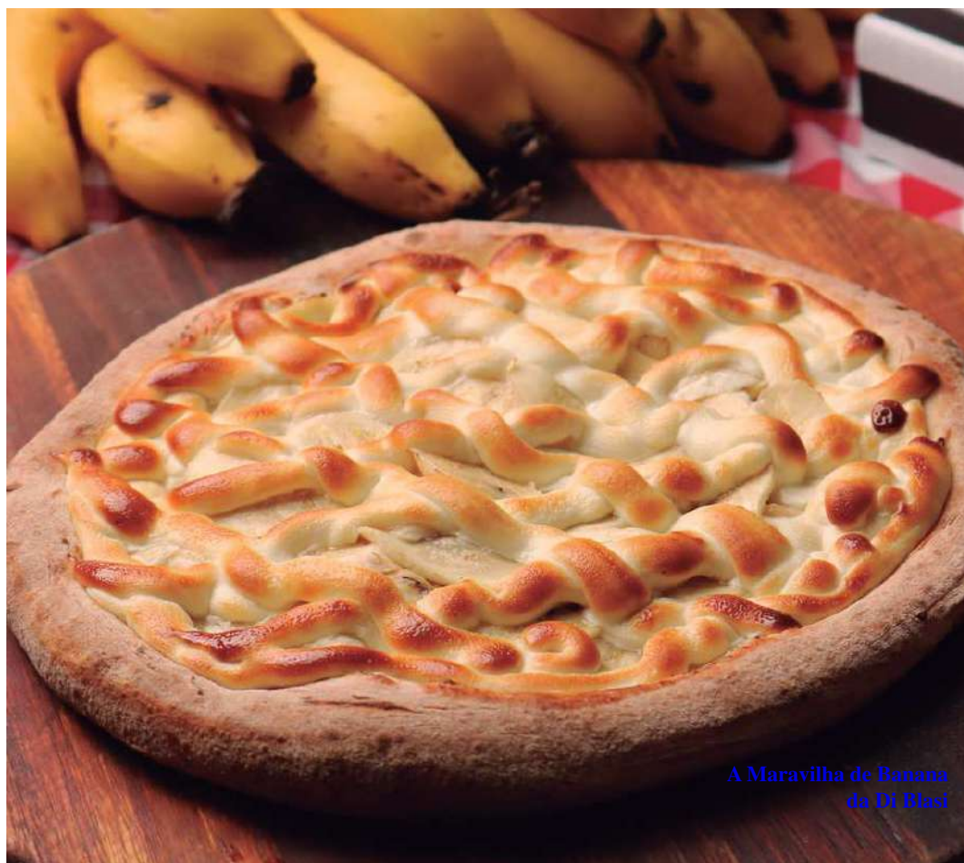
A Maravilha de Banana da Di Blasi