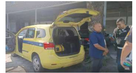
O taxista que foi conduzido à delegacia

porém acompanhado de um segundo indivíduo, que não possuía qualquer autorização para atuar no serviço.