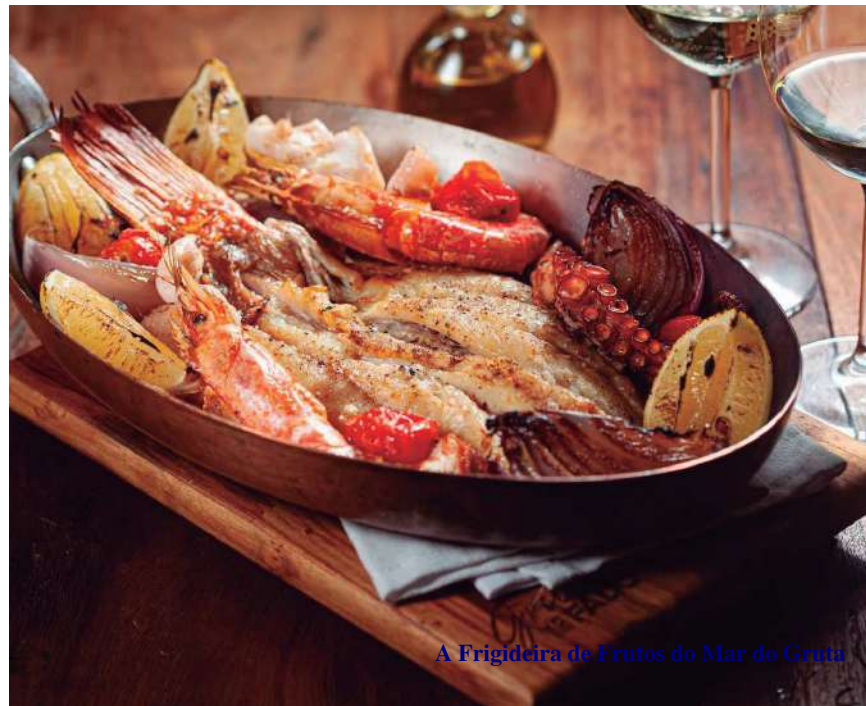
A Frigideira de Frutos do Mar do Gruta

Entre as opções mediterrâneas, está a deliciosa Frigideira de frutos do mar (foto - R$ 306 — serve duas pessoas), que traz o peixe do dia, camarões, lula e polvo grelhados.