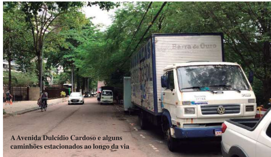
A Avenida Dulcídio Cardoso e alguns caminhões estacionados ao longo da via

“Sem contar que alguns caminhões ocupam as vagas do estacionamento durante 24h”, disse o morador, que preferiu não se identificar.