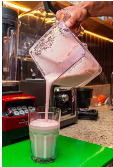
O shake Spinning: frutas vermelhas, limão, leite NAVEIA, gengibre, guaraná, beterraba, açaí sem açúcar e whey