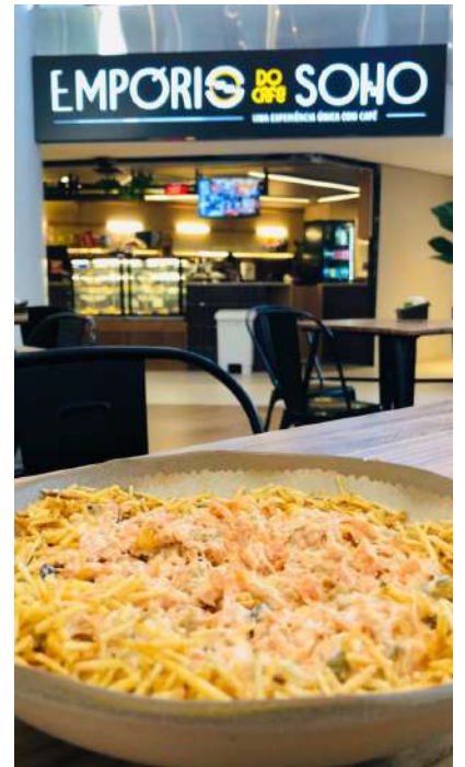
O salpicão de frango: Feito do seu jeito e com base de iogurte Grego