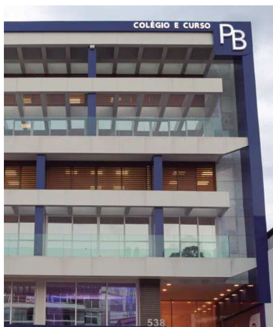
O prédio do novo PB, na Érico Veríssimo

“Há mais de 10 anos, temos nos destacado como uma instituição de referência em aprovações nos vestibulares mais concorridos do país