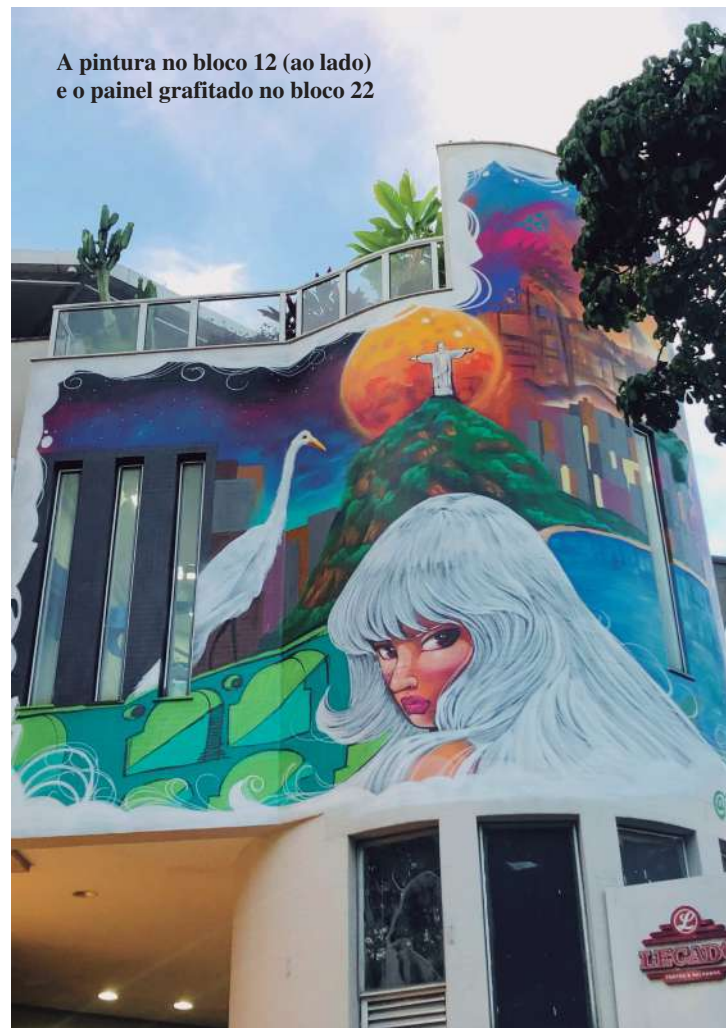
A pintura no bloco 12 (ao lado) e o painel grafitado no bloco 22