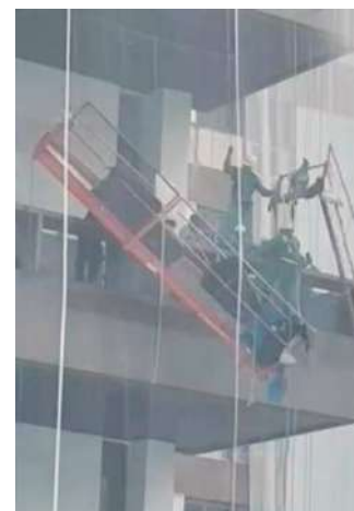
O andaime solto no Barramares

Um operário foi resgatado por colegas de trabalho, após ficar pendurado em um andaime na fachada de um prédio do condomínio Barramares, na tarde desta