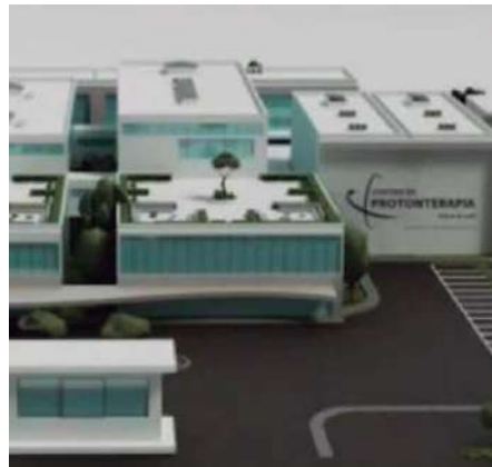
A imagem 3D do projeto

O Brasil se prepara para um marco inédito na área da saúde: a construção do Centro de Protonterapia Mário Kroeff, o primeiro do país e da América Latina. O centro será instalado em uma área de 15 mil metros, na Barra da Tijuca.