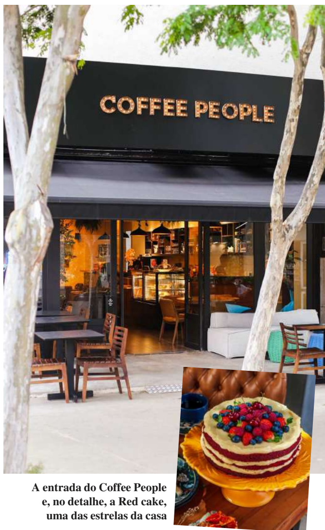
A entrada do Coffee People e, no detalhe, a Red cake, uma das estrelas da casa

Sim, meus caros, o Coffee People tem almoço executivo. E não é figurante, não. Com opções de entrada + prato principal + sobremesa, ele entra em cartaz com tilápia ao forno com purê de raízes