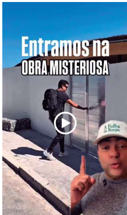
A capa do segundo vídeo sobre a obra

A mansão não terá piscina. Sim, você leu certo. Uma casa gigante, sete suítes, vista para o mar, cara de hotel boutique internacional... e sem piscina. O motivo? A ideia inicial era construir a área de lazer na parte inferior do terreno, mas a