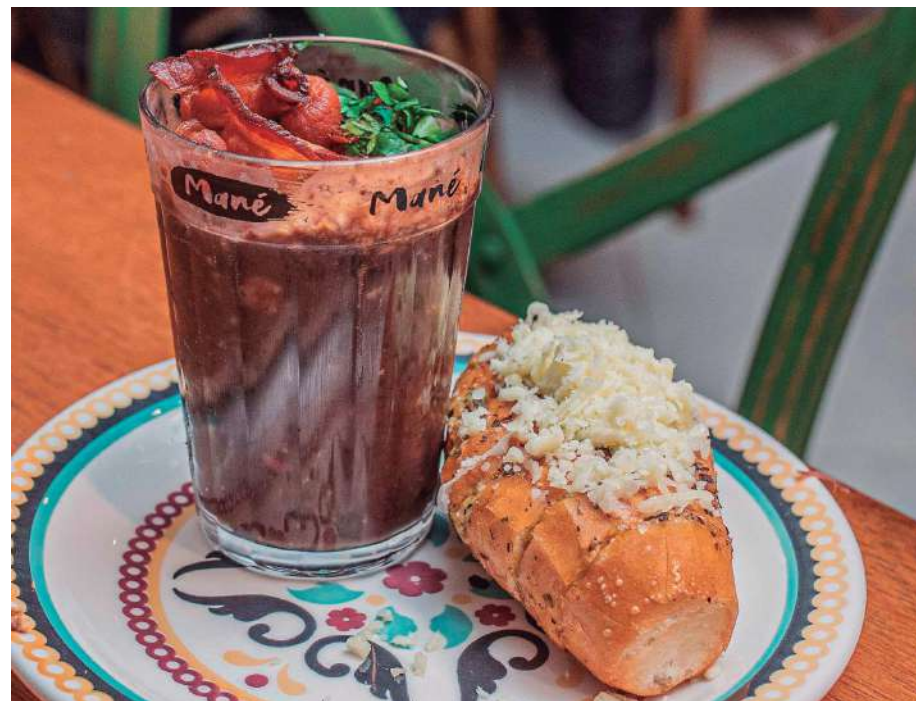
O caldinho de feijão à la Mané. Acompanhado de mini pão de alho com queijo

Aqui na Barra o Mané fica na Avenida Olegário Maciel, 260, ljs. E e F.