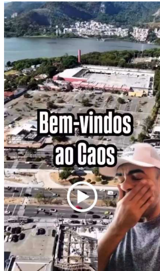
A imagem de abertura do filme na internet

Assista a esse e outros vídeos no Instagram, em @afolhadobosque