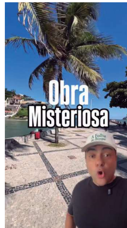
A capa do vídeo sobre a obra no Joá

E aí é que mora a graça. Porque no fundo, no fundo, o que a gente faz é exatamente isso. Com método, câmera e compromisso: observar, perguntar,