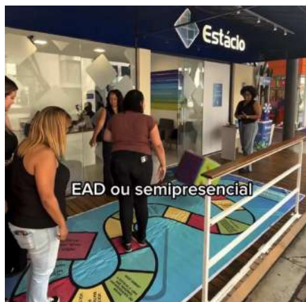
O polo no dia da inauguração

Universidade inaugura novo polo no Downtown