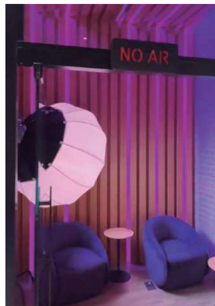
A entrada do estúdio da Vivo