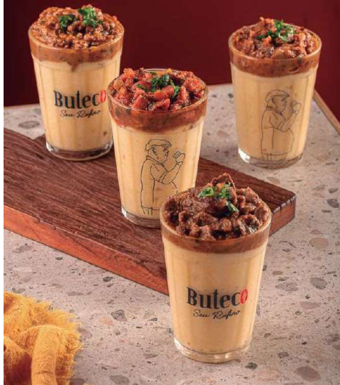
Os caldinhos de ragu do Seu Rufino