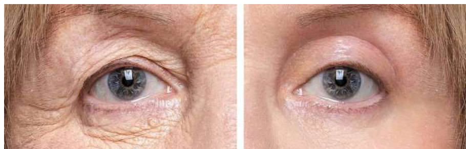
O antes e o depois da blefaroplastia

Causada pelo envelhecimento natural do corpo, a flacidez excessiva na pele das pálpebras pode fazer com que elas caiam, cobrindo parte da pupila e, assim, obstruindo o campo de visão. A pálpebra caída leva a pessoa a levantar a cabeça ou a forçar os músculos da