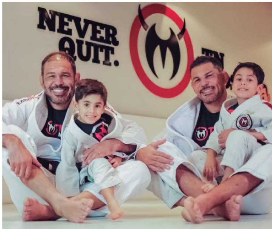
Os irmãos Nogueira na academia: ensinamentos com os ídolos do MMA, UFC e Pride

Os alunos da nova academia também têm acesso a uma sala de podcast com estrutura completa para produção de conteúdo.