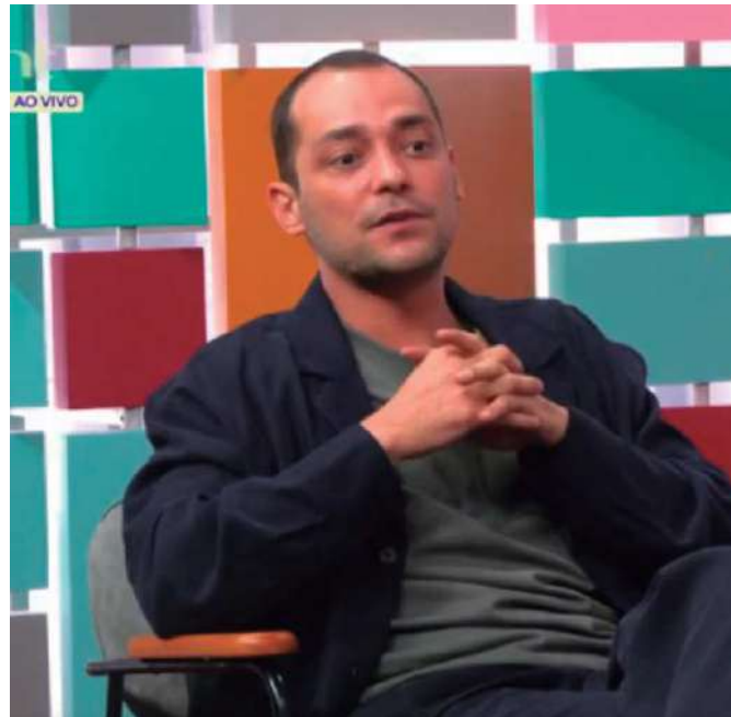
O ator no programa da GNT: "Comecei a ficar com muito medo"

"A gente não sabe exatamente, nesses momentos, como comunicar. Porque são só sentimentos muito potentes que não têm a ver