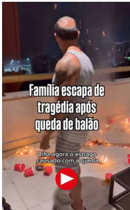
Cena do vídeo publicado no Instagram da Folha: Um morador tenta controlar o fogo na cobertura do Waterways