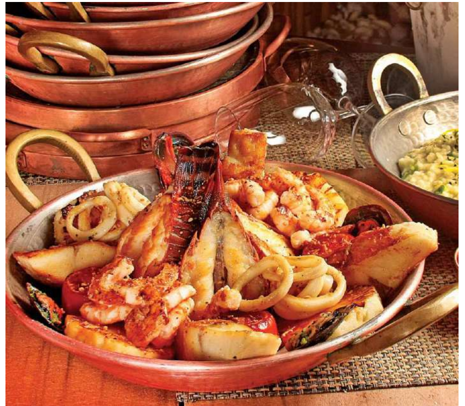
A tábua de frutos do mar grelhados do Camarada Camarão

Além da área kids a casa é pet friendly e tem espaço para eventos.