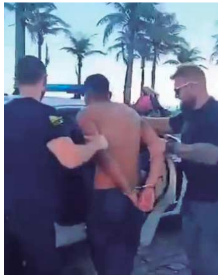
Um dos bandidos preso na orla da Barra

Dois homens foram presos em flagrante na orla da Barra da Tijuca, na quarta-feira (13 de agosto), ao tentar aplicar o golpe do falso exame. Eles se preparavam para entrar em um condomínio de luxo, quando foram presos graças à denúncia de uma vítima, que entrou em contato com agentes da 16ª DP (Barra) após suspeitar que estava prestes a cair na fraude.