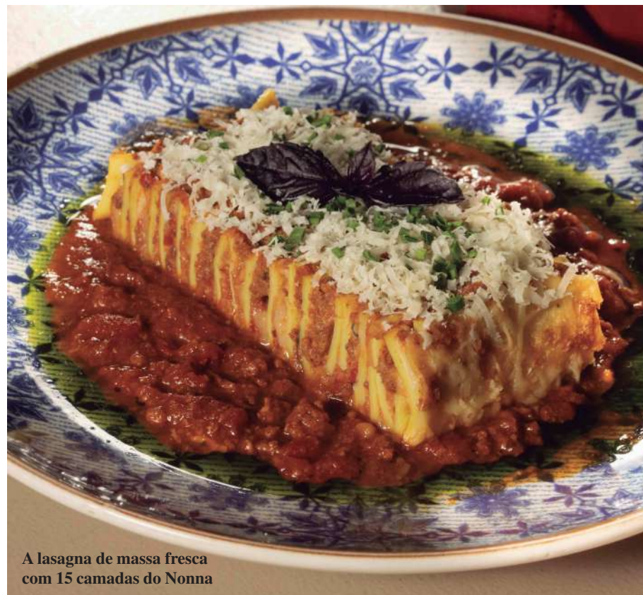
A lasagna de massa fresca com 15 camadas do Nonna

Servido de domingo a quinta-feira, durante o jantar (exceto feriados), o Senza