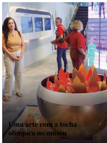
Uma arte com a tocha olímpica no museu

Instalado no andar superior do Velódromo, o museu ocupa uma área de, aproximadamente,